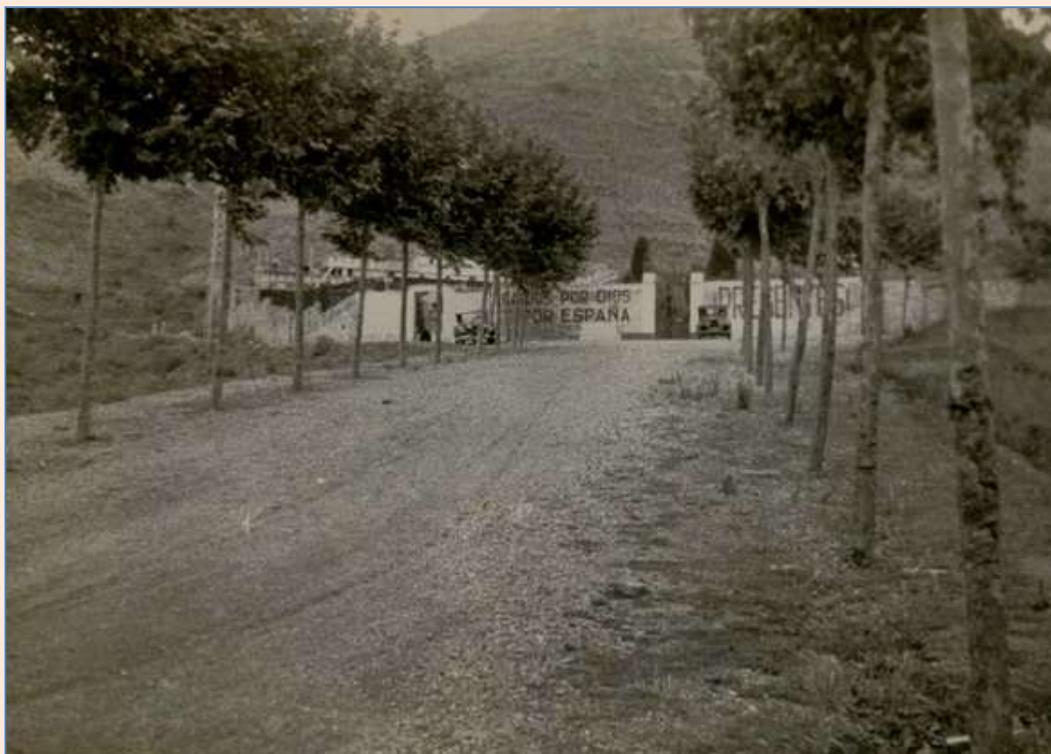
A las puertas del cementerio de Montcada i Reixac fueron asesinadas 1.168 personas. Fotografía tomada en 1940.