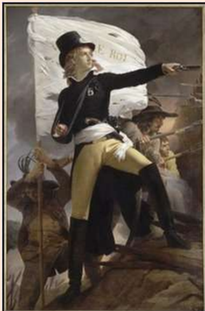
MARQUÉS HENRY DE LA ROCHEJAQUELEIN

Bastante curioso, aquellos que llevaron a cabo el genocidio en la Vendée mostraron tener la misma mentalidad perversa que más tarde encontramos en los nazis. Arrojan a mujeres y niños a hornos, usaron piel humana para hacer ropa, y quemaban a las mujeres para extraer grasa.