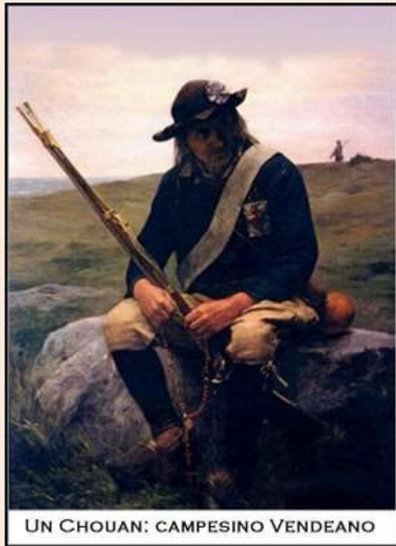
UN CHOUAN: CAMPESINO VENDEANO

En 1790, en la Francia occidental, se produjo una situación de persecución a la Iglesia bajo el amparo de la ley. Cuando los campesinos católicos de la Vendée se atrevieron a resistir a esa persecución, los legisladores ateos ordenaron el total exterminio de la población de esa región – hombres, mujeres y niños.