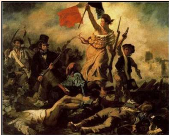
ALEGORÍA DE LA REVOLUCIÓN FRANCESA DE 1848

Bastante curioso, aquellos que llevaron a cabo el genocidio en la Vendée mostraron tener la misma mentalidad perversa que más tarde encontramos en los nazis. Arrojan a mujeres y niños a hornos, usaron piel humana para hacer ropa, y quemaban a las mujeres para extraer grasa.