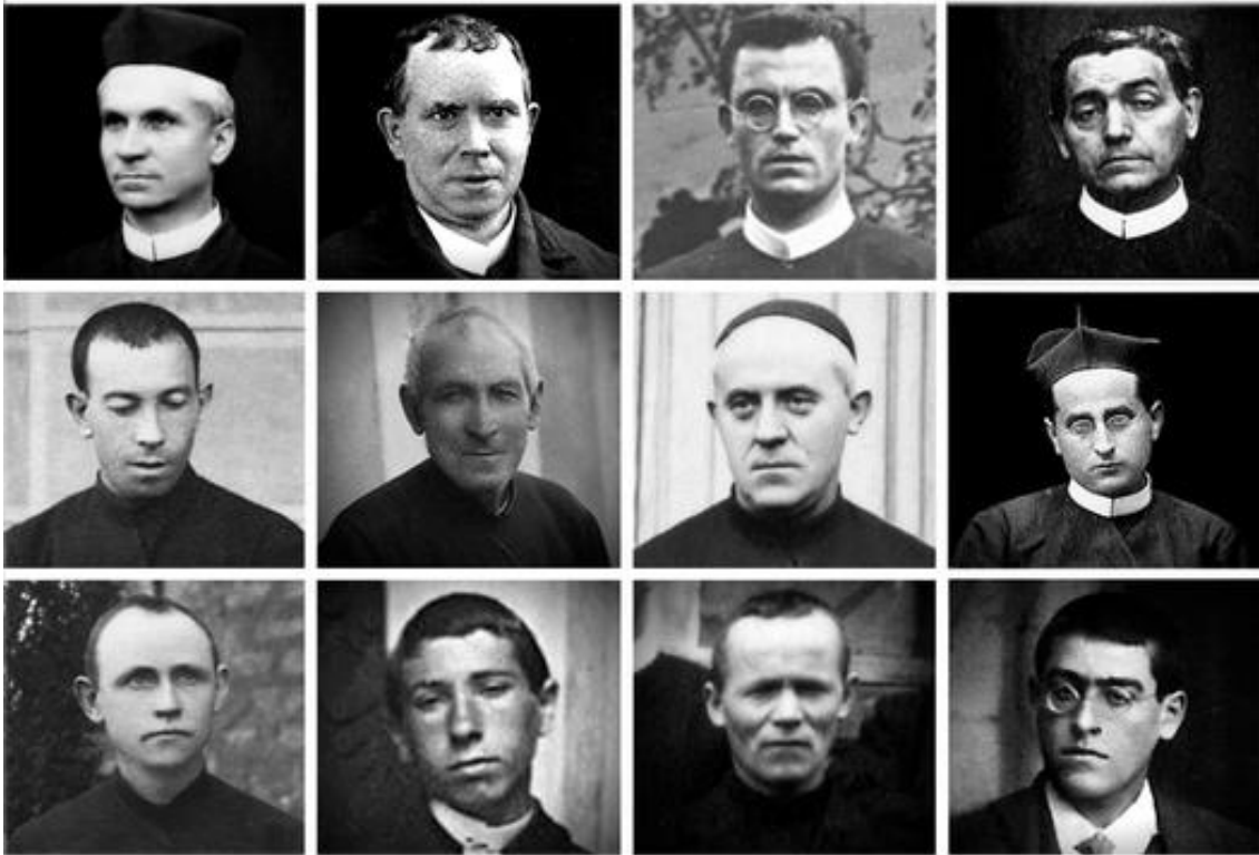
Mártires redentoristas de Madrid de 1936