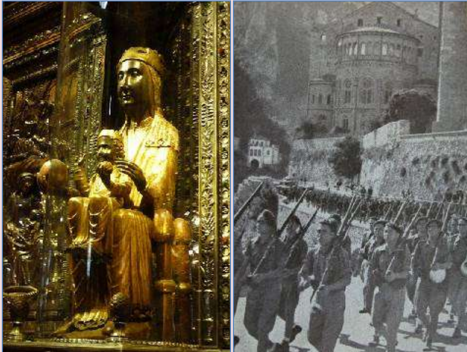
El glorioso Tercio de Requetés de Ntra. Sra. de Montserrat rinde homenaje a la Virgen

el 23 de enero de 1939. A partir de aquel momento, el pueblo catalán pudo cantar de nuevo con voz fuerte: “Rosa d’Abril, Morena de la Serra”